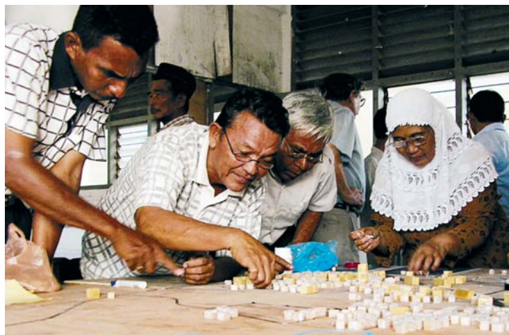
Les citoyens s'investissent dans la planification

Avec son approche fondée sur les droits de l'homme, le Ministère fédéral allemand de la Coopération économique et du Développement (BMZ) a souscrit à la mise en oeuvre systématique de l'ensemble des droits de l'homme et des principes qui y sont liés dans les secteurs et les politiques-pays. L'approche fondée sur les droits de l'homme se penche sur les causes structurelles de la pauvreté et, en conséquence, sur la répartition inégale des ressources et du pouvoir au sein de la société. Elle soutient ainsi la lutte durable contre la