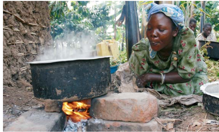
Cuisiner au feu de bois en Ouganda

Les objectifs les plus importants relatifs aux droits de l'homme pour le pôle prioritaire Energie sont mentionnés dans le Pacte international relatif aux droits économiques, sociaux et culturels de 1966 (en abrégé : Pacte social). La perspective des droits de l'homme se base sur le droit à un logement adapté, inscrit dans l'article 11 du Pacte social. Selon le Comité qui veille au respect du Pacte social des Nations Unies, ce droit consiste entre autres en « un accès durable à .... l'énergie pour cuisiner, chauffer et s'éclairer... » Par ailleurs, le Pacte social reconnaît dans l'article 15, alinéa 1b, « à chacun le droit [...] de bénéficier du progrès scientifique et de ses applications. » Parmi ces progrès, on compte au XXI e siècle l'électricité et aussi les énergies renouvelables.