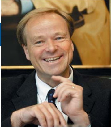
Ministre fédéral allemand de la Coopération économique et du Développement, Dirk Niebel

Le respect, la protection et la garantie des droits de l'homme représentent le fondement du développement démocratique, économique et culturel de chaque pays. De ce fait, les droits de l'homme constituent une priorité du Gouvernement fédéral allemand et une mission transversale qui concerne tous les domaines politiques. La politique allemande de développement défend consciemment une politique axée sur des valeurs qui s'inspirent des droits de l'homme. A l'avenir, nous renforcerons encore cet engagement!