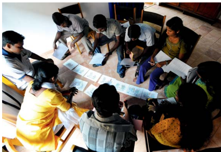
Comprendre les conflits : Communication non violente à Sri Lanka

Les droits de l'homme engagent l'Etat en tant que débiteur d'obligations à respecter ces dernières, à protéger sa population contre des violations par des tiers et à assurer l'application de l'ensemble des droits de l'homme. Or, dans des Etats fragiles et marqués par des conflits en particulier, ce sont les Etats même qui portent atteinte aux droits de l'homme ou qui ne sont