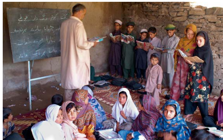
Apprendre, même dans des conditions difficiles

Le droit à l'éducation est défini dans les articles 13 et 14 du Pacte international relatif aux droits économiques, sociaux et culturels de 1966 (en abrégé : Pacte social).