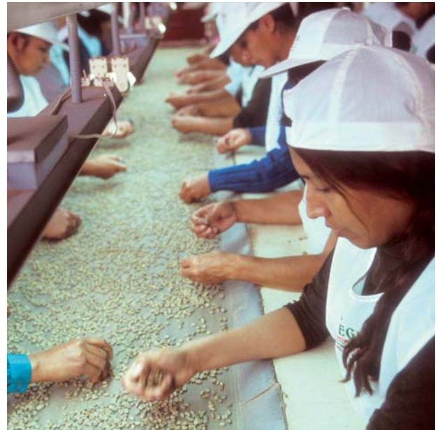
Tri des grains de café au Pérou

Les investissements et les activités entrepreneuriales peuvent influencer positivement sur les droits de l'homme ou bien porter atteinte à ces derniers (par exemple en favorisant le travail des enfants, les émissions toxiques ou les évacuations forcées). Les droits de l'homme et les normes fondamentales du travail de l'Organisation Internationale du Travail (OIT) (interdiction des pires formes du travail des enfants et interdiction du travail forcé, non-discrimination, droit à la liberté syndicale) définissent des normes minimales pour une vie dans la dignité et dans la liberté, en fixant le cadre des activités économiques.