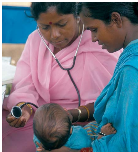
Visite médicale à domicile en Inde, photo : GTZ/Richard Lord

Dans ses Observations générales de 2000, le Comité des Nations Unies (NU) responsable de l'application du