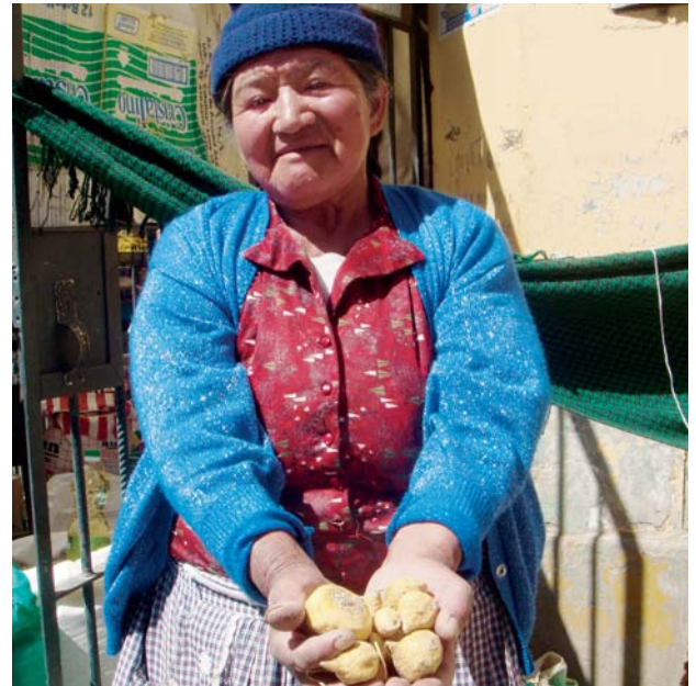
Une femme et ses pommes de terre maca au Pérou

Le droit à la nourriture en quantité suffisante est défini dans l'article 11 du Pacte international relatif aux droits économiques, sociaux et culturels de 1966 (en abrégé : Pacte social). Par ailleurs, il est aussi inscrit dans d'autres conventions telles que la convention des droits de l'enfant et la convention sur les droits de la femme. Cette dernière accorde une attention particulière à la concrétisation de l'égalité pour les femmes dans le développement rural.