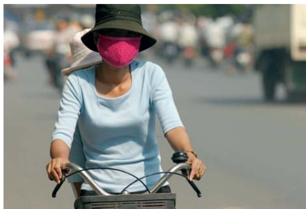
Femme à vélo au Cambodge

Les droits de l'homme d'une importance particulière pour le pôle prioritaire « Protection de l'environnement et des ressources naturelles » sont inscrits dans le Pacte relatif aux droits civils et politiques (en abrégé : Pacte civil) et dans le Pacte relatif aux droits économiques, sociaux et culturels (en abrégé : Pacte social). Les comités des Nations Unies qui interprètent les deux pactes et veillent à leur respect ont rendu concrets les droits de l'homme qui y sont inscrits, entre autres dans les Observations générales : d'une part, un environnement propre est considéré comme condition indispensable à la réalisation d'un grand nombre de droits de l'homme, notamment des droits à la santé, à l'alimentation et à l'eau ; d'autre part, l'accès aux fondements naturels de la vie et leur utilisation sont jugés comme un aspect de l'identité socioculturelle des minorités indigènes qui mérite d'être protégé. L'élaboration d'un droit de l'homme autonome à un environnement propre est en cours de