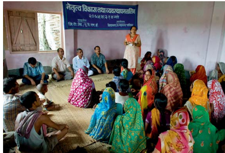
Les citoyens discutent au Népal

Les objectifs des différents droits de l'homme sont énoncés dans les Observations générales des deux pactes internationaux relatifs aux droits civils et politiques ainsi qu'aux droits économiques, sociaux et culturels. Ces Observations générales fournissent des indications concrètes pour aménager les politiques dans les différents secteurs également au niveau local.