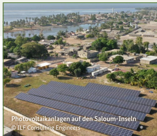
Photovoltaikanlagen auf den Saloum-Inseln

Am 22. Juni 2023 wurde die Partnerschaft beim Summit for a New Global Financial Pact in Paris besiegelt. Deutschland und Frankreich koordinieren die an der Partnerschaft beteiligten G7-Geber, zu denen auch Großbritannien, Kanada und die Europäische Union gehören. Um die JETP zügig voranzubringen, hat Senegal zusammen mit den Partnern sogenannte Fast-Track -Projekte identifiziert, die bereits auf der Weltklimakonferenz 2023 gestartet wurden. Deutschland finanziert über die KfW Entwicklungsbank zwei Projekte, die den Stromzugang bzw. die Integration erneuerbarer Energien ins senegalesische Stromnetz verbessern.