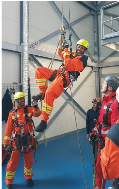
↑ Gemeinsam für den Ernstfall: Kollegialer Austausch schafft Wissen und Vertrauen.

Sie wollen sich schnell und unkompliziert über Finanzierungsmöglichkeiten Ihres nachhaltigen Projekts informieren? Sie wollen ein entwicklungspolitisches Partnerschaftsprojekt beginnen oder ausbauen, doch die kommunalen Mittel sind begrenzt? Dann können wir Ihnen unkomplizierte Möglichkeiten zur finanziellen Förderung Ihres Engagements und eine umfangreiche Datenbank zur Information bieten!