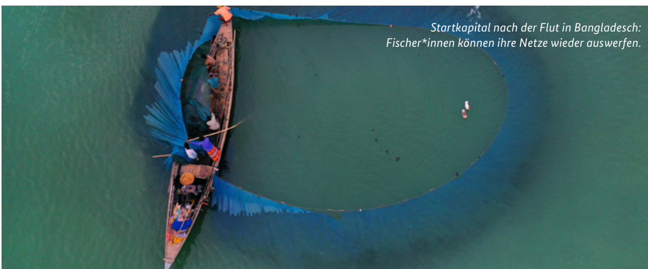
Startkapital nach der Flut in Bangladesch: Fischer*innen können ihre Netze wieder auswerfen.

Anpassung an den Klimawandel tragen sie zu längerfristigen Transformationskapazitäten bei. So hat sich beispielsweise die Bereitstellung von verbessertem Saatgut als äußerst kosteneffektive Maßnahme mit großem Potenzial zur Stärkung der Resilienz vulnerabler Bevölkerungsgruppen in ländlichen Regionen bewährt. Ein weiteres Beispiel sind ökosystembasierte Ansätze wie