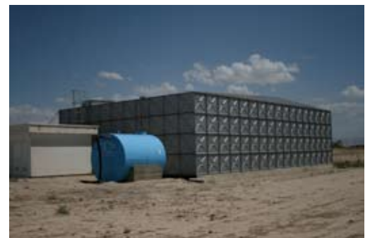
Neuer Wassertank in Kunduz.

„Wir möchten erreichen, dass die Menschen in Kunduz beispielsweise weniger chemische Reiniger oder große Mengen Chlor benutzen, die dann ungefiltert im Grundwasser landen, das sie dann selbst wieder trinken“, sagt der Berater. Um den Unterschied zwischen verschmutztem niedrigem und sauberem tieferem Grundwasser zu verdeutlichen, hat Riebel in Zusammenarbeit mit afghanischen Frauen eine simple Zeichnung erstellt.