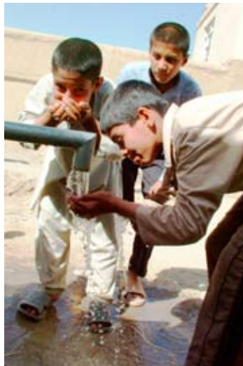
An 120 öffentlichen Anschlüssen in Kunduz gibt es sauberes Wasser aus Tiefbrunnen.

Der neue Wassertank in Kunduz versorgt rund 21.000 Menschen der nordafghanischen Stadt mit sauberem Wasser. Seit etwa einem Jahr läuft die Wasserverteilung über diesen Tank, der rund 1250 Kubikmeter der kostbaren Ressource fassen kann. „Eine absolut notwendige Anschaffung“, bestätigt Eberhard Riebel (DED), technischer Berater der städtischen Wasserwerke in Kunduz.