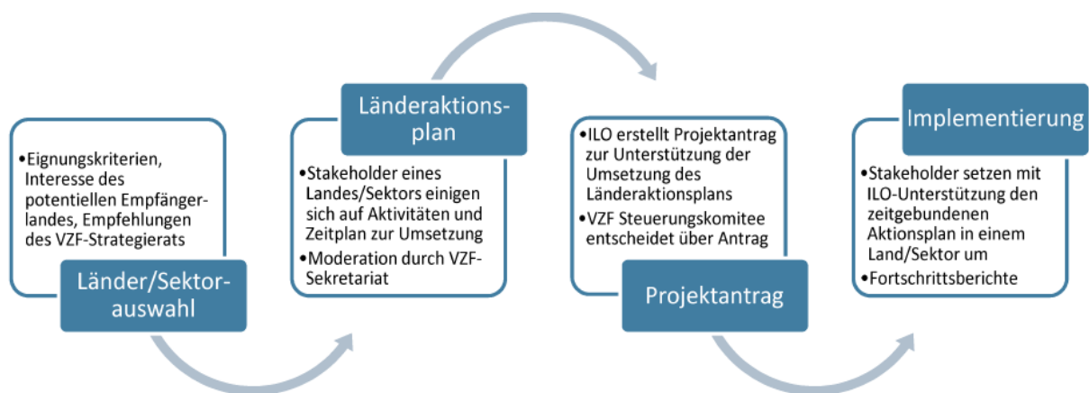
Abbildung 2: VZF-Projektdurchführung