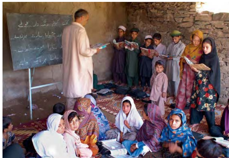
Lernen, auch unter schwierigen Bedingungen

Das Menschenrecht auf Bildung ist in Art. 13 und 14 des Internationalen Pakts über wirtschaftliche, soziale und kulturelle Rechte von 1966 (kurz: Sozialpakt) festgelegt. Es findet sich auch in anderen Menschenrechtskonven-