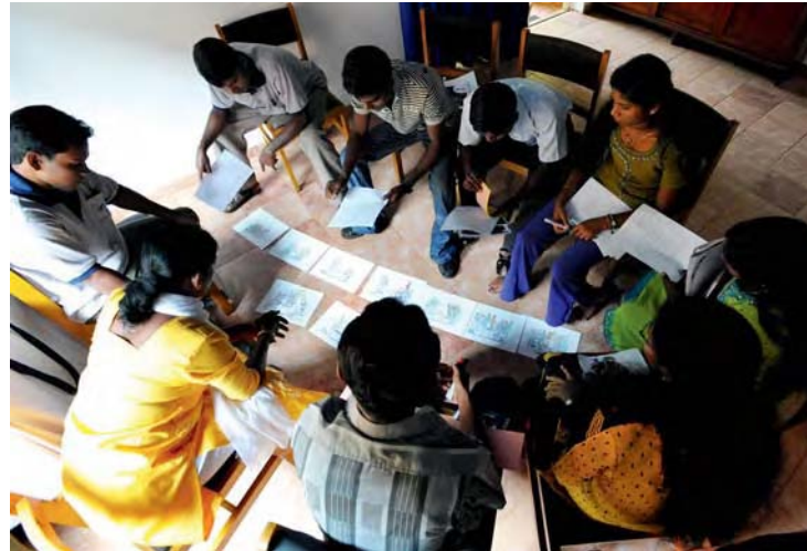
Konflikte verstehen: Gewaltfreie Kommunikation in Sri Lanka

Menschenrechte verpflichten den Staat als Pflichten-träger, diese zu achten, seine Bevölkerung vor Verletzungen durch Dritte zu schützen und die Umsetzung aller Menschenrechte zu gewährleisten. Gerade in fragilen und von Konflikten geprägten Staaten beeinträchtigen jedoch Staaten selbst Menschenrechte oder sind nicht willens oder in der Lage, das menschen-