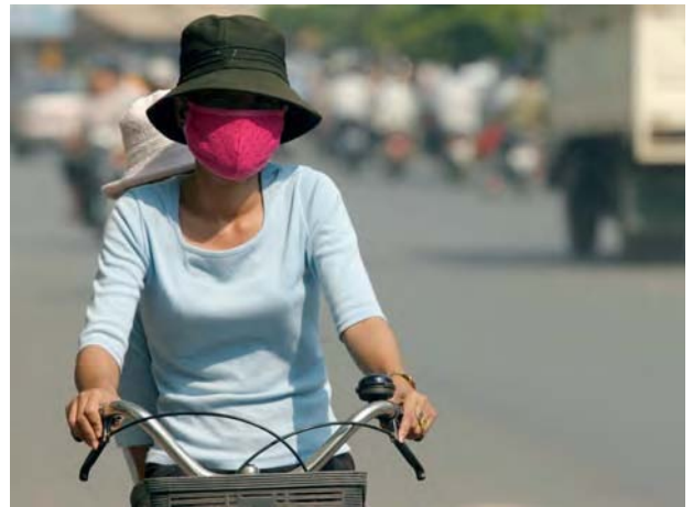
Fahrradfahrerin in Kambodscha

Die für den Schwerpunkt Umwelt- und Ressourcenschutz besonders relevanten Menschenrechte sind im Pakt über bürgerliche und politische Rechte (kurz: Zivilpakt) und im Pakt über wirtschaftliche, soziale und kulturelle Rechte (kurz: Sozialpakt) verankert. Die VN-Ausschüsse, die die beiden Pakte auslegen und ihre Einhaltung überwachen, haben – unter anderem in den so genannten Allgemeinen Bemerkungen – die dort niedergelegten Menschenrechte konkretisiert: Zum einen gilt eine saubere Umwelt als eine unabdingbare Voraussetzung für die Verwirklichung zahlreicher Menschenrechte, insbesondere der Rechte auf Gesundheit, Nahrung und Wasser; zum anderen wird der Zugang zu und die Nutzung von natürlichen Lebensgrundlagen als ein schützenswerter Aspekt der soziokulturellen Identität von indigenen Minderheiten gesehen. Die Entwicklung eines eigenständigen Menschenrechts auf saubere Umwelt ist in der Diskussion. Der menschenrechtliche Ansatz legt einen Fokus auf Personen und Gruppen, die von Umweltverschmut-