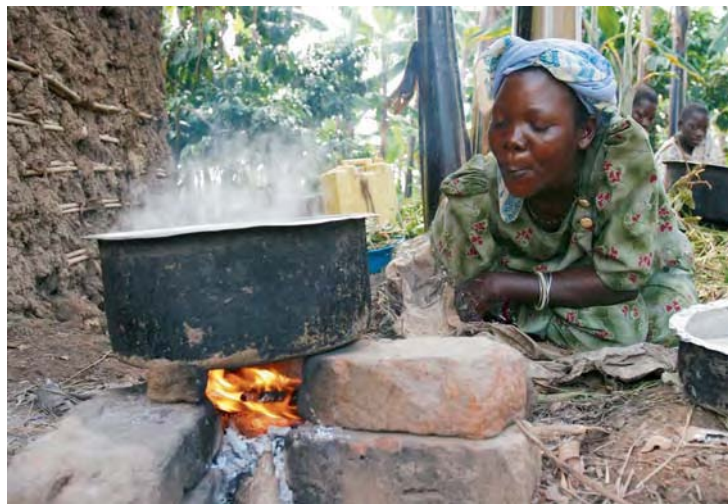
Kochen auf dem Holzfeuer in Uganda

Die wichtigsten menschenrechtlichen Zielvorgaben für den Schwerpunkt Energie sind im Internationalen Pakt über wirtschaftliche, soziale und kulturelle Rechte von 1966 (kurz: Sozialpakt) enthalten. Die menschenrechtliche Perspektive speist sich aus dem Menschenrecht auf angemessene Unterbringung, verankert in Art. 11 des Sozialpakts. Laut dem Ausschuss, der über die Einhaltung des VN-Sozialpakts wacht, besteht dieses Recht unter anderem im „nachhaltigen Zugang zu ... Energie für Kochen, Heizung und Beleuchtung ...“. Zusätzlich sichert der Sozialpakt in Art. 15 (1b) „das Recht eines jeden, an den Errungenschaften des wissenschaftlichen Fortschritts und seiner Anwendung teilzuhaben.“ Zu diesen Errungenschaften gehören im 21. Jahrhundert neben Elektrizität auch die regenerativen Energien.