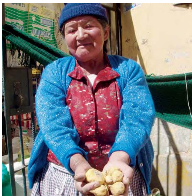
Frau mit Maca-Kartoffeln in Peru, Foto: GTZ

Das Menschenrecht auf angemessene Nahrung ist in Art. 11 des Internationalen Pakts über wirtschaftliche, soziale und kulturelle Rechte von 1966 (kurz: Sozialpakt) enthalten. Darüber hinaus ist es auch in anderen Konventionen verankert, so in der Kinderrechtskonvention und der Frauenrechtskonvention. Letztere legt einen speziellen Schwerpunkt auf die Verwirklichung einer gleichberechtigten Stellung von Frauen in der ländlichen Entwicklung.