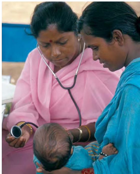
Hausbesuch in Indien

Der VN-Ausschuss, der über die Umsetzung des Sozialpakts wacht, hat in seiner Allgemeinen Bemerkung