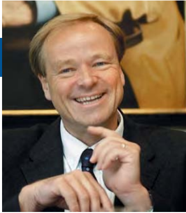
Bundesentwicklungsminister Dirk Niebel

Achtung, Schutz und Gewährleistung der Menschenrechte sind das Fundament für die demokratische, wirtschaftliche und kulturelle Entwicklung jeden Landes. Menschenrechte sind daher Priorität der Bundesregierung und Querschnittsaufgabe für alle Politikbereiche. Die deutsche Entwicklungspolitik vertritt bewusst eine wertorientierte Politik, für die Menschenrechte Leitprinzip sind. Und dieses Engagement werden wir in Zukunft weiter stärken!