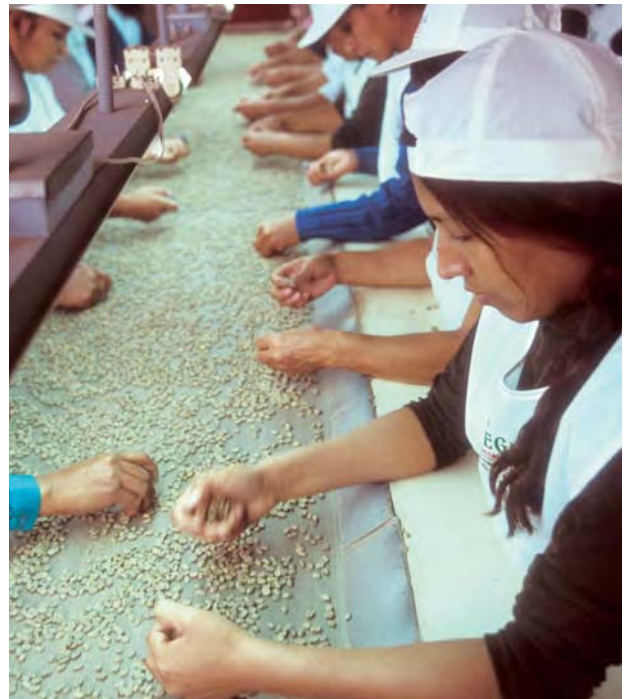
Sortieren von Kaffeebohnen in Peru

In ihren Allgemeinen Bemerkungen haben die Vertragsorgane der Vereinten Nationen (VN) die Substanz der einzelnen Menschenrechte und die Pflichten des Staates ausgeführt. Der Staat muss die Menschenrechte achten. Mit Blick auf das Recht auf Arbeit darf er