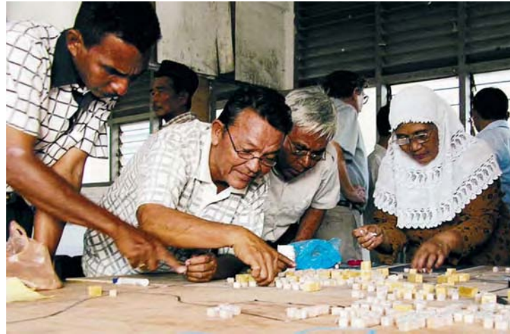
Bürger planen mit

Der MRA führt zu einem Perspektivwechsel: Aus „Zielgruppen“ und „Bedürftigen“ werden Träger/innen rechtlicher Ansprüche, aus staatlichen Partnerorganisationen Pflichtenträger. Beide Gruppen werden in ihren