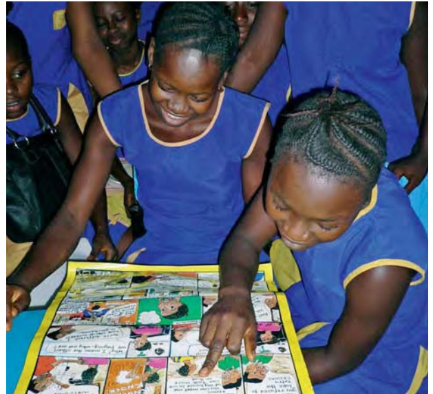
Sensibilisierung zu Korruption in der Schule, Sierra Leone

Auch wenn die internationalen Menschenrechtsverträge sich nicht explizit auf Korruption beziehen, so haben insbesondere die VN-Vertragsorgane zu den beiden Internationalen Pakten über bürgerliche und politische Rechte (Zivilpakt) und wirtschaftliche, soziale und kulturelle Rechte (Sozialpakt) in ihren