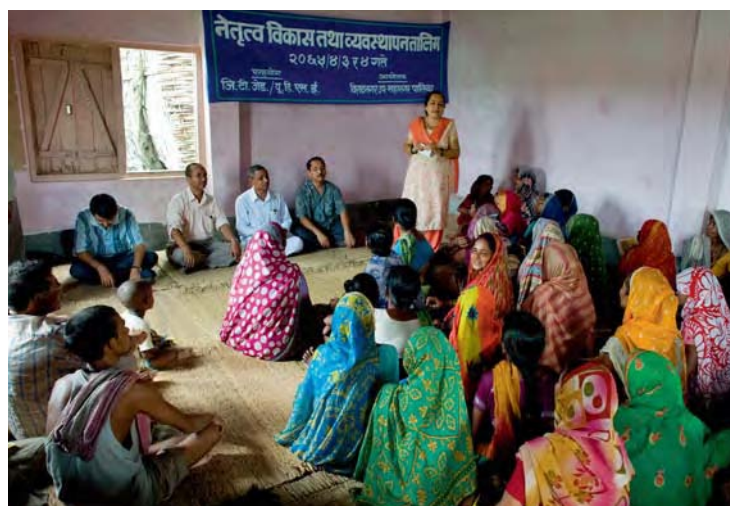
Bürgerinnen und Bürger diskutieren in Nepal

Die Zielvorgaben der einzelnen Menschenrechte werden in den Allgemeinen Bemerkungen zu den beiden Internationalen Pakten über bürgerliche und politische sowie über wirtschaftliche, soziale und kulturelle Rechte erläutert. Diese Allgemeinen Bemerkungen geben konkrete Hinweise für die Gestaltung von Politiken in den einzelnen Sektoren auch auf lokaler Ebene.