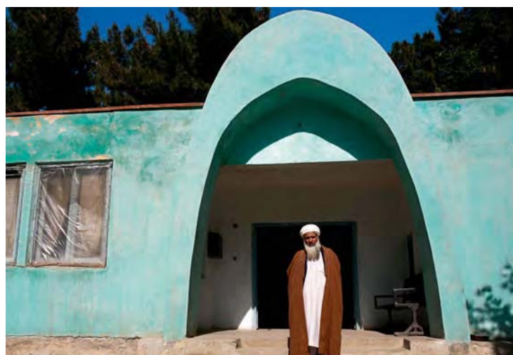
Berufungsgericht in Afghanistan, Foto: GTZ/Travis Beard

Das Menschenrecht auf „Gleichheit vor Gericht und ein faires und öffentliches Verfahren vor einem unabhängigen und gesetzlichen Gericht“ ist in Art. 14 des Internationalen Paktes über politische und bürgerliche