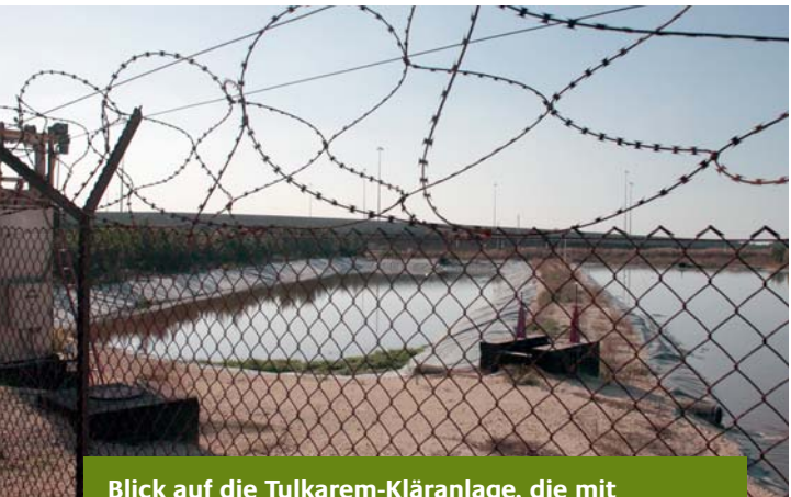
Blick auf die Tulkarem-Kläranlage, die mit Stacheldraht umzäunt ist

Das von Beginn an konfliktträchtige Verhältnis zwischen Palästinensern und Israelis verschlechterte sich weiter, als in den 90er Jahren Friedensverhandlungen erneut scheiterten und im Jahre 2000 die zweite Intifada ausbrach. Seitdem bestimmen Gewalt und Gegengewalt immer wieder den Alltag vor Ort, insbesondere im Gazastreifen. Regelmäßig kommt es zu Raketenbeschuss israelischer Städte aus dem Gazastreifen und zu Übergriffen durch israelische Siedler im Westjordanland. Die dreiwöchige israelische Militäroperation im Gazastreifen zur Jahreswende 2008/2009 führte zu großen Verlusten unter der palästinensischen Zivilbevölkerung und verschärfte die humanitäre und wirtschaftliche Situation vor Ort.