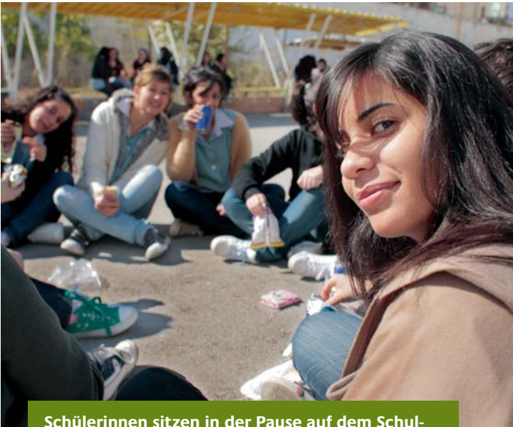
Schülerinnen sitzen in der Pause auf dem Schulhof der Othman Iben Afan Schule (Nablu)