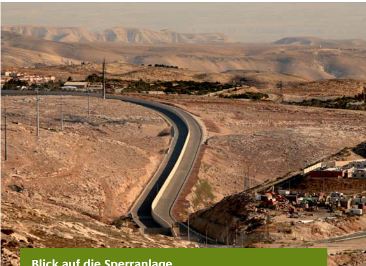
Blick auf die Sperranlage

Mit dem Zivilen Friedensdienst (ZFD) hat die Bundesregierung 1999 ein neues Instrument zur Friedenssicherung und Krisenprävention geschaffen. Zu den Aufgabenfeldern der speziell ausgebildeten Fachkräfte des ZFD gehören