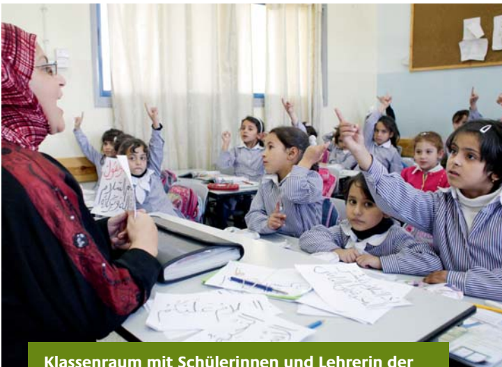
Klassenraum mit Schülerinnen und Lehrerin der Deir Sharaf Grundschule (Nablus)

Die negativen Folgen dieser Entwicklung treffen weite Teile der palästinensischen Bevölkerung: Es herrscht hohe Arbeitslosigkeit und weit über die Hälfte der Bevölkerung lebt unterhalb der Armutsgrenze. Um den vielen jungen Menschen eine Perspektive zu geben, müssen moderne Ausbildungsangebote und ausreichend Arbeitsstellen zur Verfügung stehen.