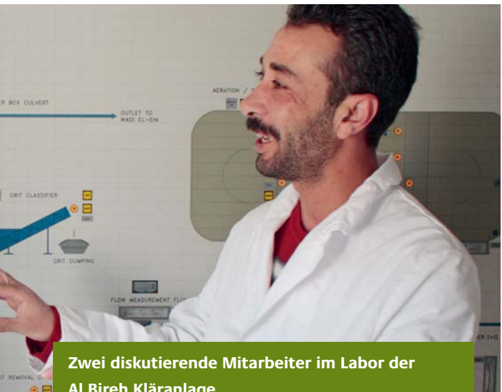
Zwei diskutierende Mitarbeiter im Labor der Al Bireh Kläranlage

Bis zum Jahr 2015 werden durch den deutschen Beitrag die Kapazitäten für eine bürgernahe kommunale Verwaltung und eine finanziell stabile und effiziente Erbringung von Basisdienstleistungen für die Bürger erheblich erweitert. Hiervon wird direkt und indirekt die gesamte Bevölkerung in den Gemeinden der Palästinensischen Gebiete profitieren. Langfristig tragen diese Maßnahmen entscheidend zur nachhaltigen Verbesserung des Angebots an kommunaler Infrastruktur und Dienstleistungen