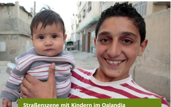
Straßenszene mit Kindern im Qalandia Flüchtlingslager (Jerusalem)

Das Bevölkerungswachstum in den Palästinensischen Gebieten ist hoch. Mehr als die Hälfte der Bevölkerung ist unter 18 Jahre alt. Den vielen jungen Menschen die Chance auf ein Leben in materieller und sozialer Sicherheit zu geben, ist deshalb wichtiges Ziel der Zusammenarbeit zwischen der Palästinensischen Autonomiebehörde und Deutschland.