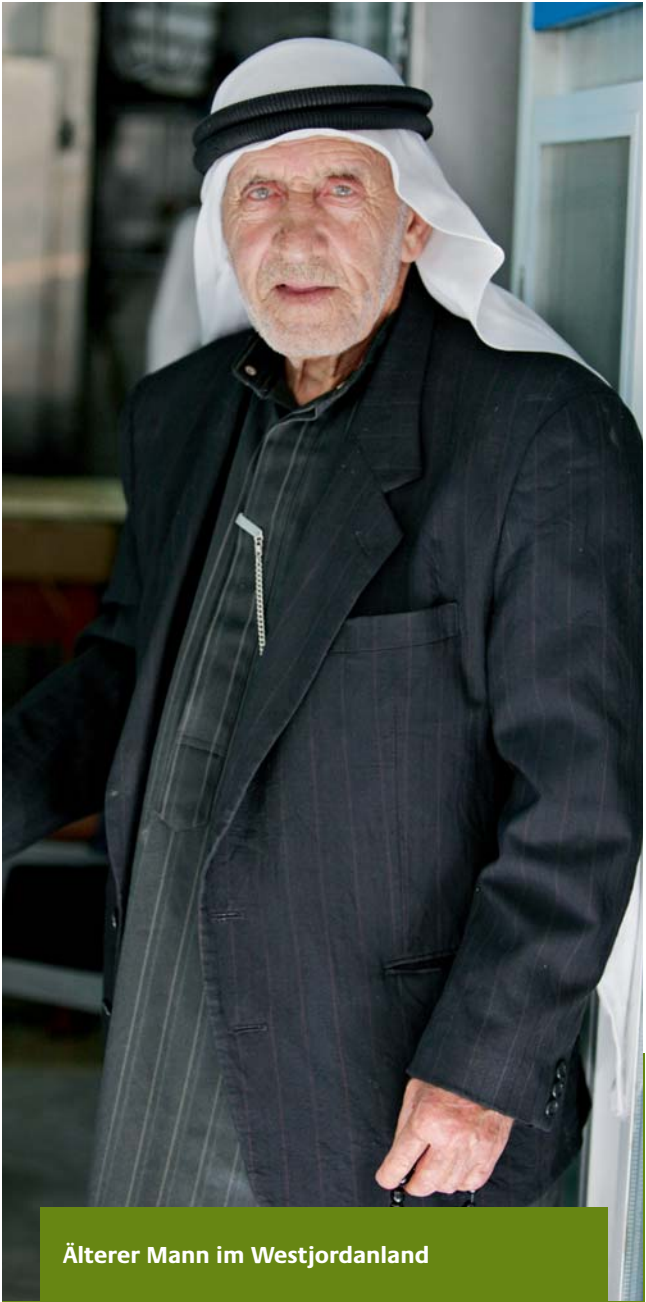
Älterer Mann im Westjordanland