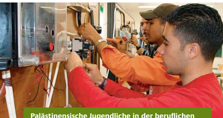
Palästinensische Jugendliche in der beruflichen Ausbildung, Elektrogewerbe

Zur nachhaltigen Verbesserung der Lebenssituation der Bevölkerung hat die Bundesregierung zusammen mit den palästinensischen Partnern umfangreiche Beschäftigungsprogramme auf den Weg gebracht. So sieht ein Programm den Neubau und die Sanierung von mehr als 100 Schulen für circa 80.000 Schülerinnen und Schüler vor. Dadurch, dass die Bauaufträge ausschließlich lokal vergeben werden, profitieren kleine und mittlere palästinensische Unternehmen und es entstehen über 5.000 temporäre Arbeitsplätze. Durch den Ausbau der Grund- und weiterführenden Schulen erhalten insbesondere arme Menschen einen besseren Zugang zu Bildung und sozialer Infrastruktur. Durch ein Programm zur Förderung des Berufsbildungssystems sollen außerdem junge Menschen aus allen Schichten besseren Zugang zu einer qualifizierten Ausbildung bekommen. Auf Basis der langjährigen Erfahrungen im Bereich Schulbau engagiert sich die Bundesregierung zukünftig in Kooperation mit anderen Gebern im Rahmen eines umfassenden, gemeinsamen Programms zur Förderung des palästinensischen Bildungssektors.